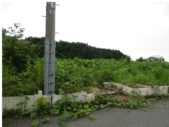
電気（敷地内電柱あり）